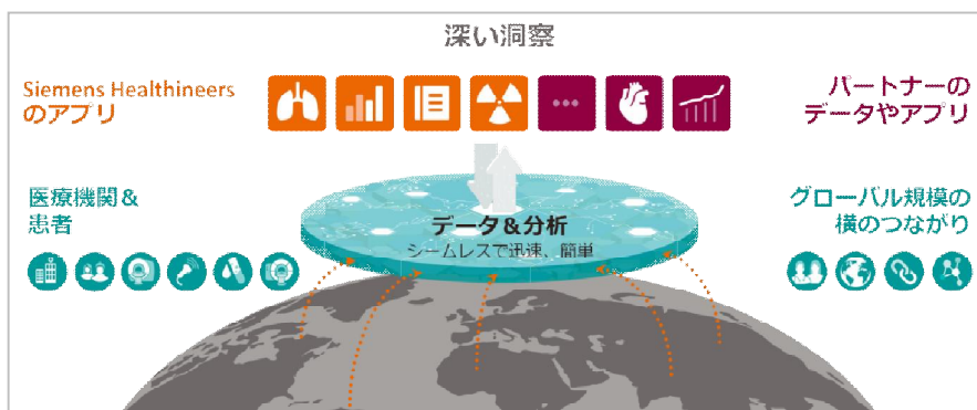
図 2 : シーメンスヘルスケアの目指す「デジタルエコシステム」

オープンでセキュアなクラウド環境をベースにした仕組みのことで、医療機関、医療従事者、患者、自治体、メーカーやパートナーを含むすべてのステークホルダーがつながり、連携し、よりよいアプリやサービスの提供や活用を促進していくものです。たとえば、メーカーやパートナーは、開発したアプリやサービスをすぐに利用できる環境に接続でき、一方の医療従事者は、必要に応じてそれをいち早く活用できるなどのメリットがあります。このようにユーザーとプロバイダーとのつながりにより有機的な発展を遂げていくことから、デジタルエコシステムと呼んでいます。