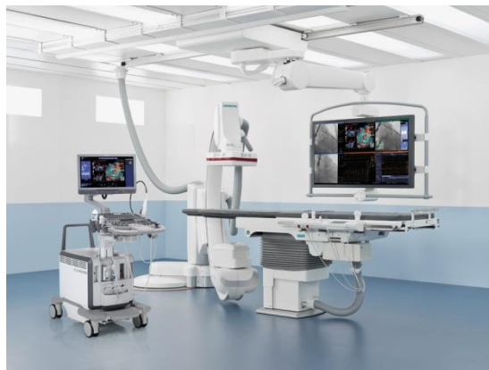
超音波診断装置 ACUSON SC2000 PRIME（左）と X線血管撮影装置 Artis zee シリーズ（右）