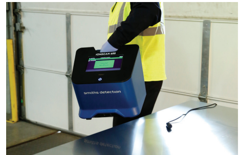
Leicht und problemlos portabel für dynamische Sicherheitscreening-Umgebungen Tragegriff nur an Gerät ohne Drucker verfügbar

Wenn Sie Produktinformationen wünschen, Unterstützung beim Kauf benötigen oder Serviceanfragen haben, besuchen Sie unsere Website unter www.smithsdetection.com/locations